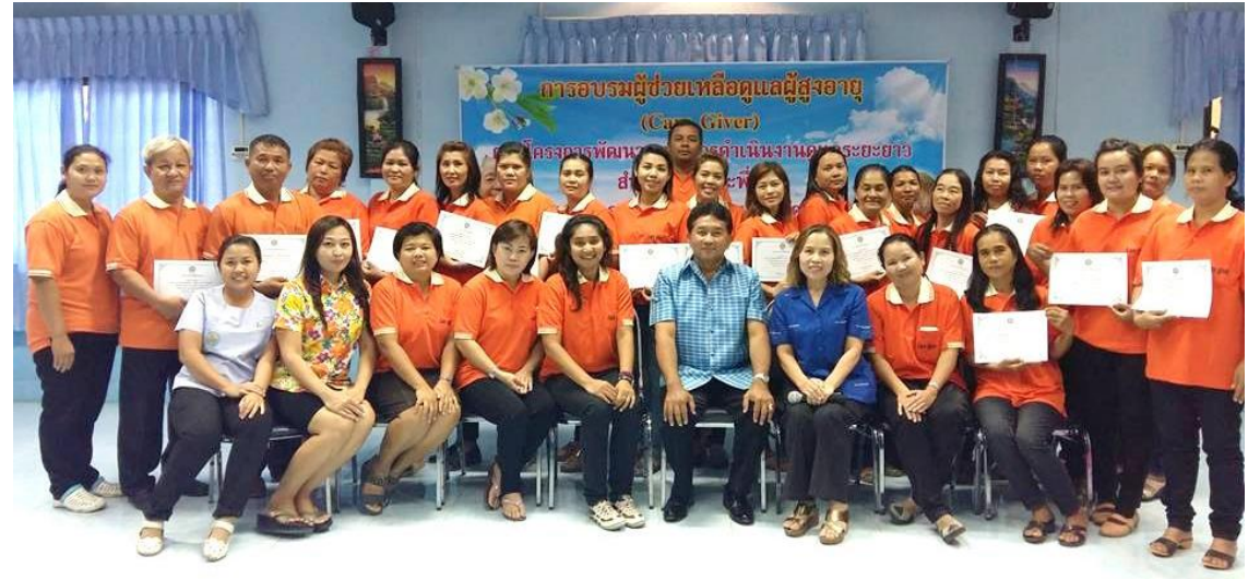
การดำเนินกิจกรรมการปฏิบัติงานของ CG